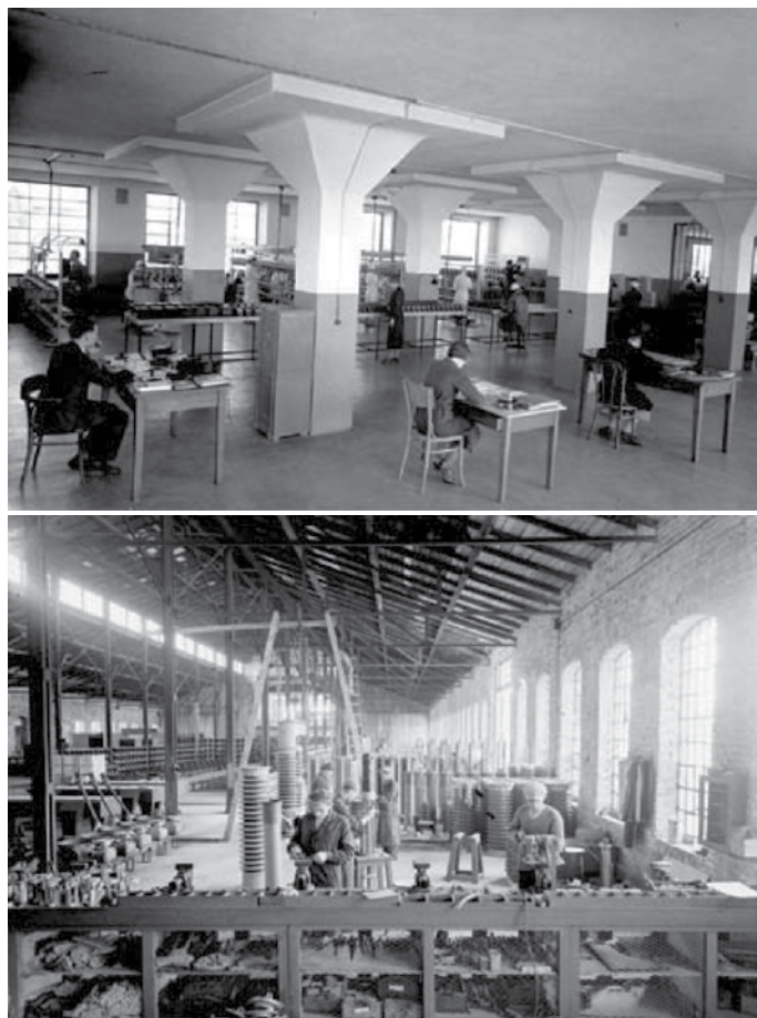
Fot. 3 i 4. Fabryka Aparatów Elektrycznych K. Szpotański i Spółka S.A. (FAE)

nictwa Przemysłowego w Warszawie, gdzie pracował od sierpnia 1951 r. do grudnia 1956 r., tj. do momentu odejścia na emeryturę.