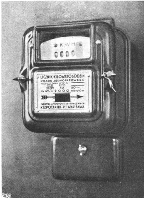
Fot. 2. Licznik zalegalizowany przez Główny Urząd Miar jako typ BT 3 RTP 3,85. Urządzenie zostało wykonane przez FAE według najnowszych wówczas wymagań techniki, zarówno więc jego wykonanie, jak i kontrola wykonania dały gwarancję, aby licznik znalazł całkowite uznanie

Świadectwem bardzo wysokiego poziomu wyrobów FAE były liczne odznaczenia i wyróżnienia, także zagraniczne, m.in. na Wszechświatowej Wystawie w Nowym Jorku w 1939 r.